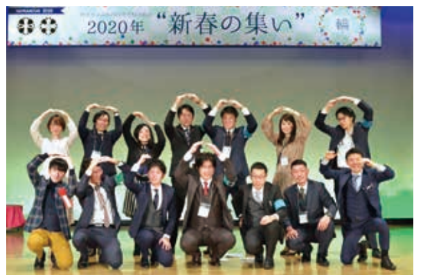
→ 2020年の新春の集いを終えて記念撮影