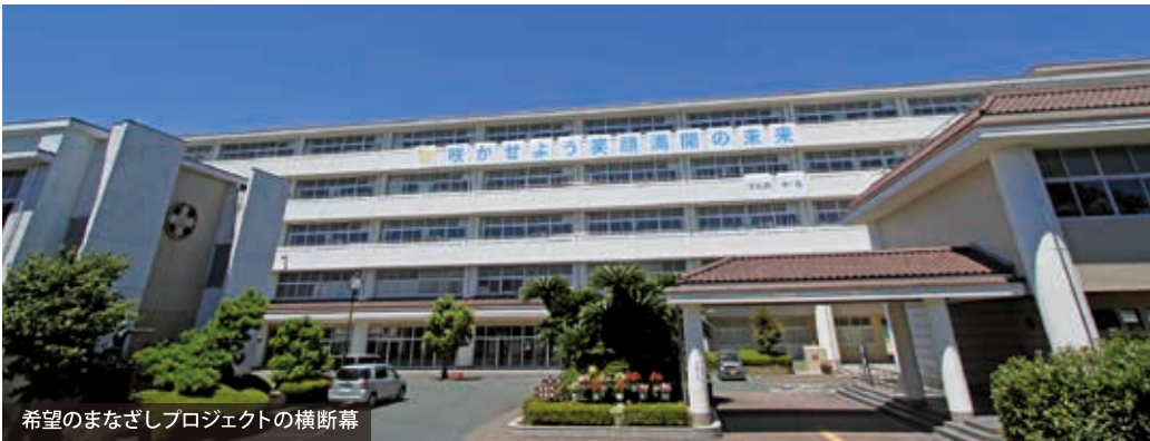
希望のまなざしプロジェクトの横断幕

感染収束に向けては、ワクチンや特效薬の早期開発が待たれますが、実現には相当な時間を要するとの見方が多く、当面は現在の生活様式を続けていかななくてはならないでしょう。このような時こそ、できないこと、不安なことを嘆くのではなく、現状を受け入れた上で、今、自分に何ができるか、何をすべきかを前向きに考え、実践することが大切ではないでしょうか。共にコロナ禍を乗り越えていきたいと思います。