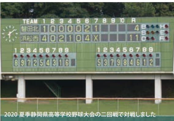
2020 夏季静岡県高等学校野球大会の二回戦で対戦しました

試合会場や色々なところで、「西高頑張れよ」と声をかけていただくことが多くなってきました。野球が大好きな素晴らしい選手たちと、皆様の応援を受けて戦えることは監督冥利に尽きます。何とか昭和56年以来2度目の甲子園に行き、再び甲子園で「銀くもりなき」の校歌を歌いたい。そんな気持ちで今後も全身全霊で指導してまいります。